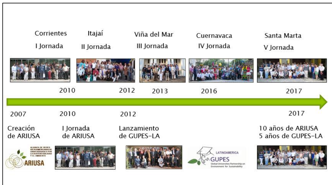
Gráfico 1 Principales eventos en la historia de ARIUSA. 2007 – 2017

Un esquema de los principales eventos durante los primeros 10 años de ARIUSA, se presenta en el siguiente gráfico: